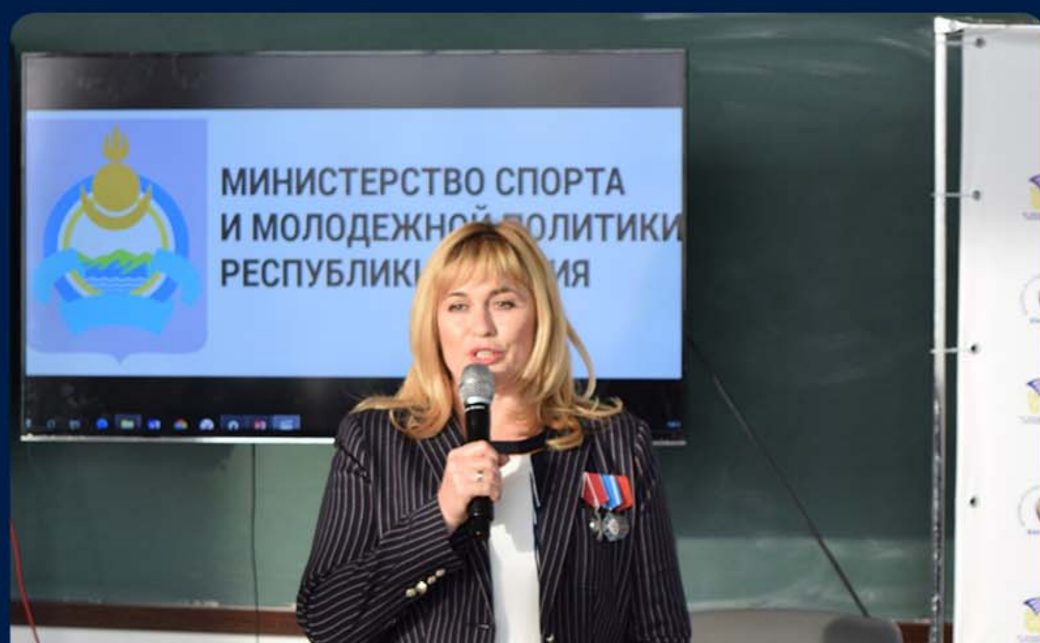
«ДИАЛОГИ С ГЕРОЯМИ». РО РЕСПУБЛИКИ БУРЯТИЯ.