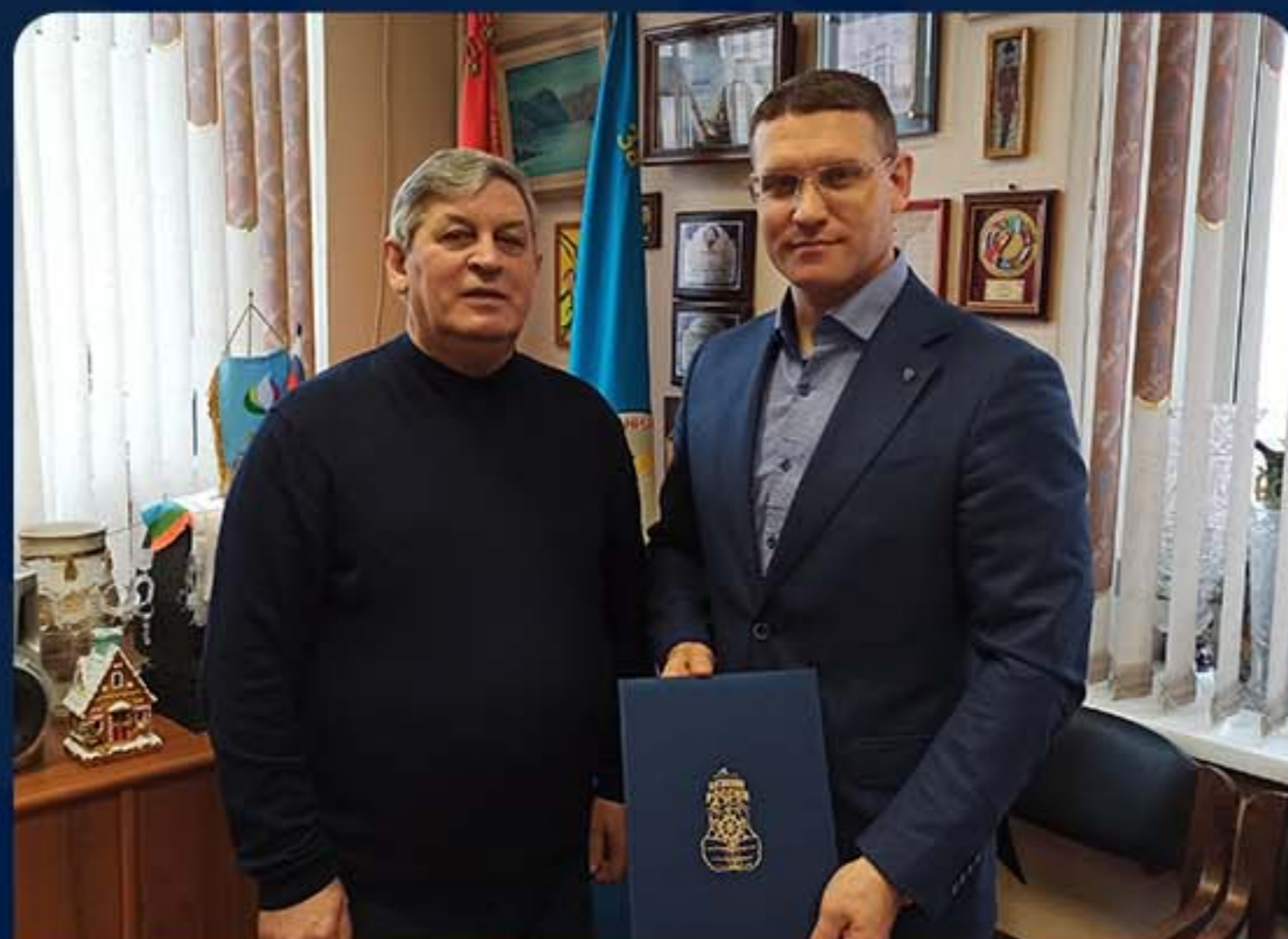
СОЮЗ ПИОНЕРСКИХ ОРГАНИЗАЦИЙ - ФЕДЕРАЦИЯ ДЕТСКИХ ОРГАНИЗАЦИЙ Г. МОСКВА