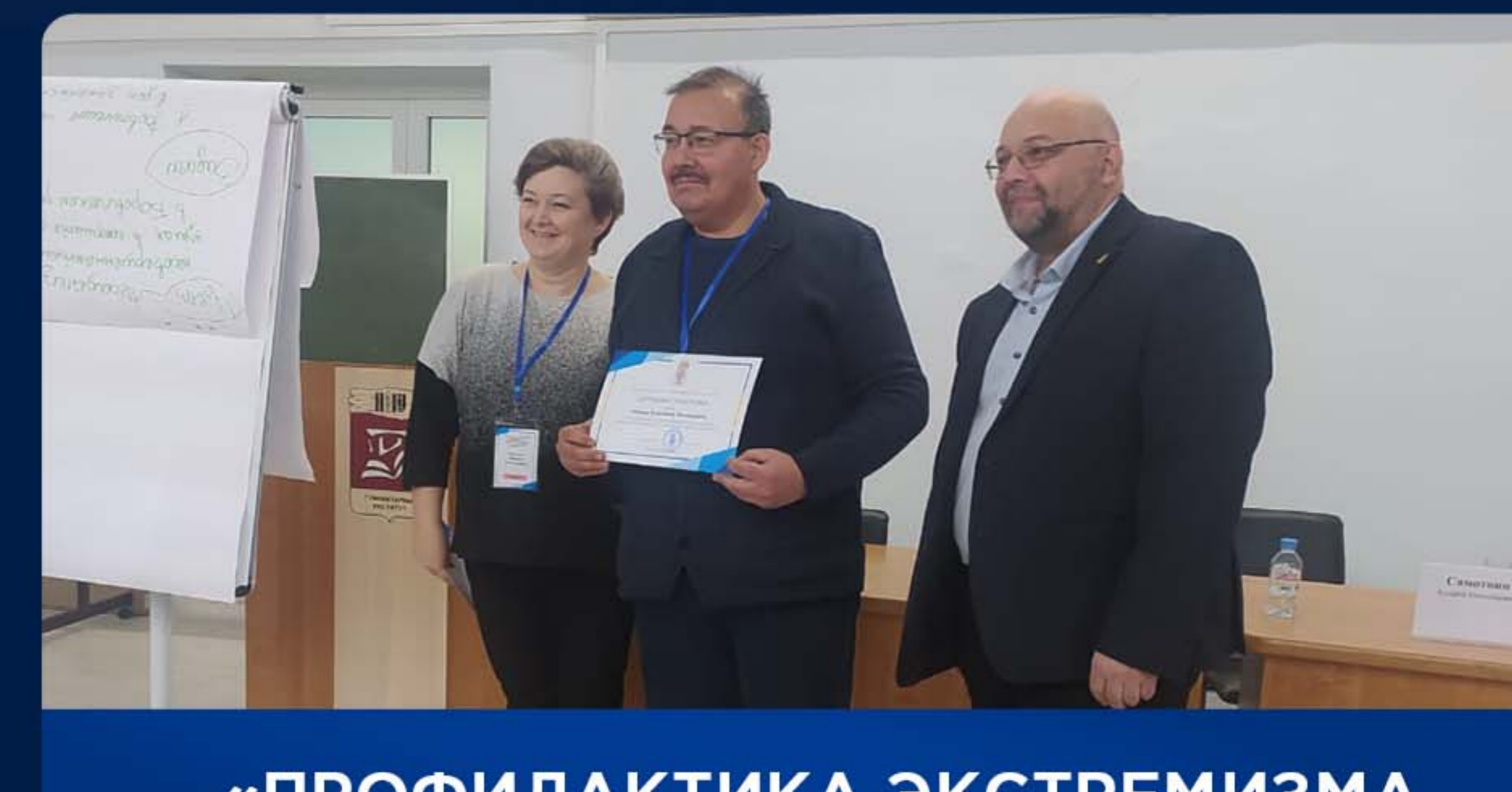
«ПРОФИЛАКТИКА ЭКСТРЕМИЗМА И ПРАВОНАРУШЕНИЙ СРЕДИ НЕСОВЕРШЕННОЛЕТНИХ»