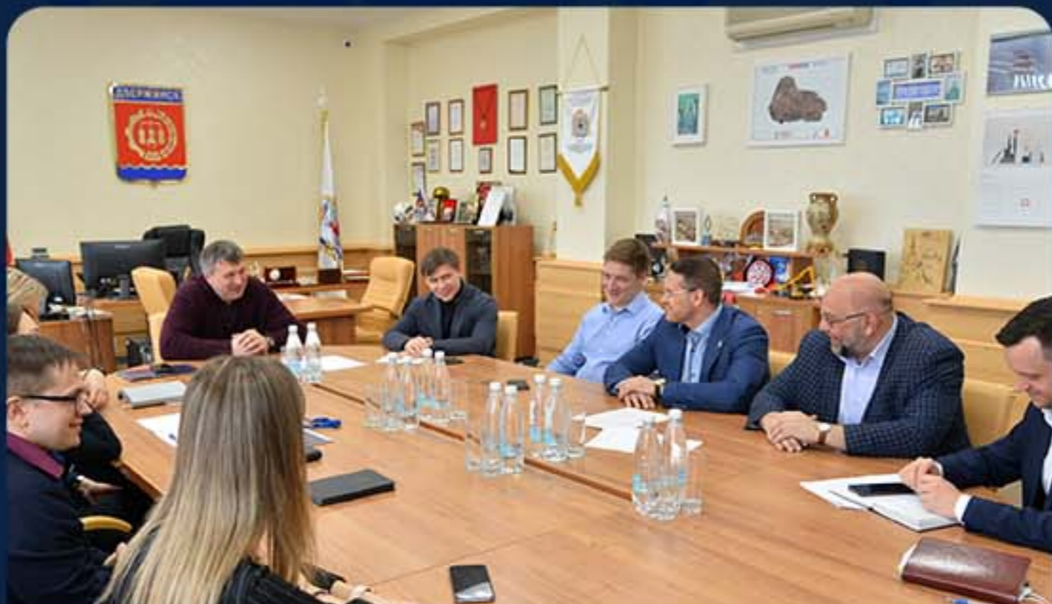
АДМИНИСТРАЦИЯ Г. ДЗЕРЖИНСК, НИЖЕГОРОДСКОЙ ОБЛАСТИ