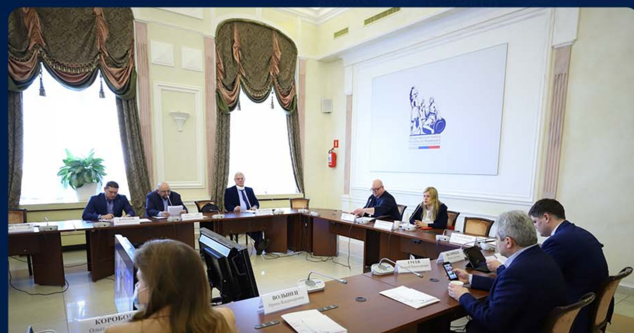
«НАСТАВНИЧЕСТВО – ПУТЬ РАЗВИТИЯ»

ОБЩЕЕ КОЛИЧЕСТВО УЧАСТНИКОВ: БОЛЕЕ 3 000 ЧЕЛ