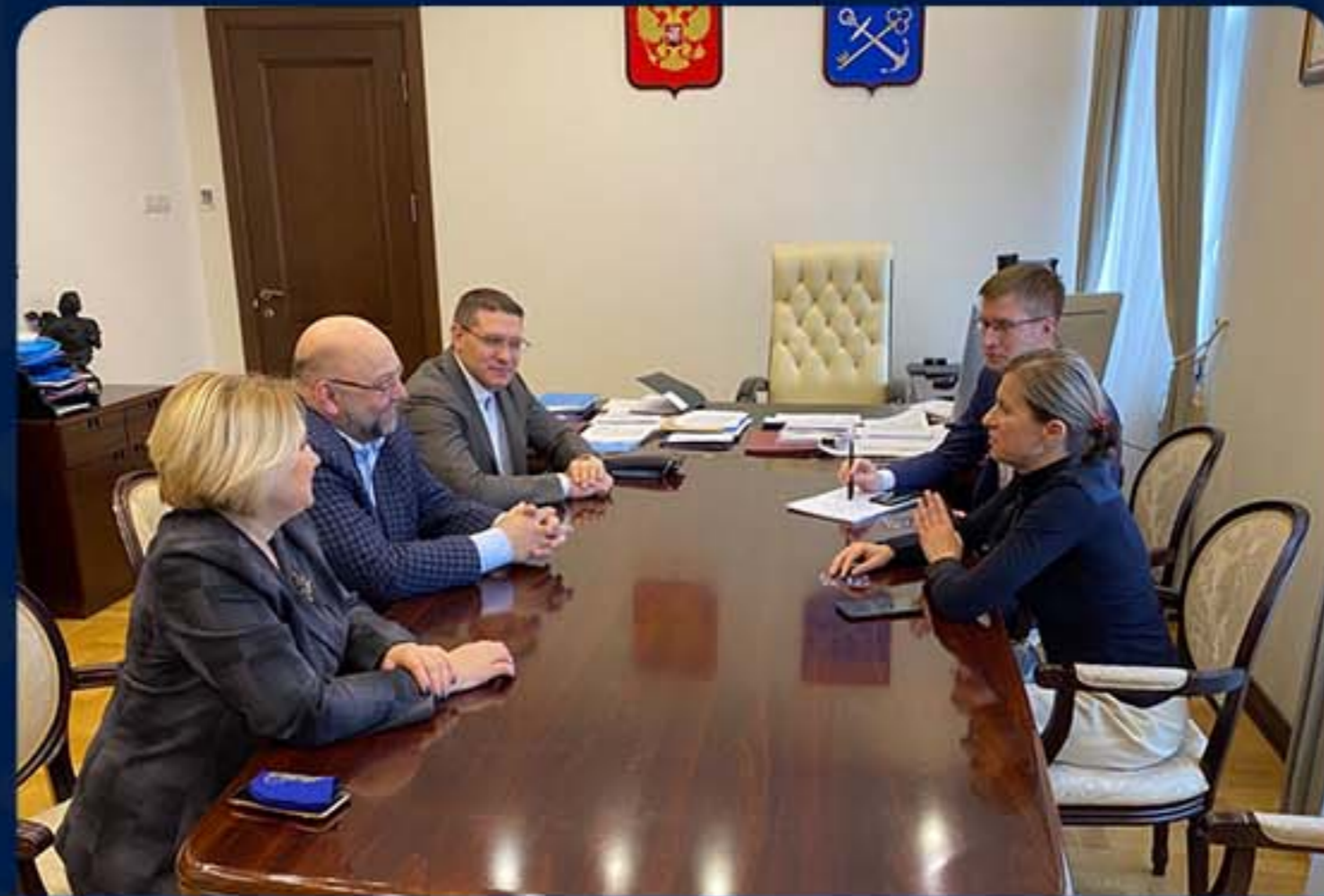
ПРАВИТЕЛЬСТВО ЛЕНИНГРАДСКОЙ ОБЛАСТИ