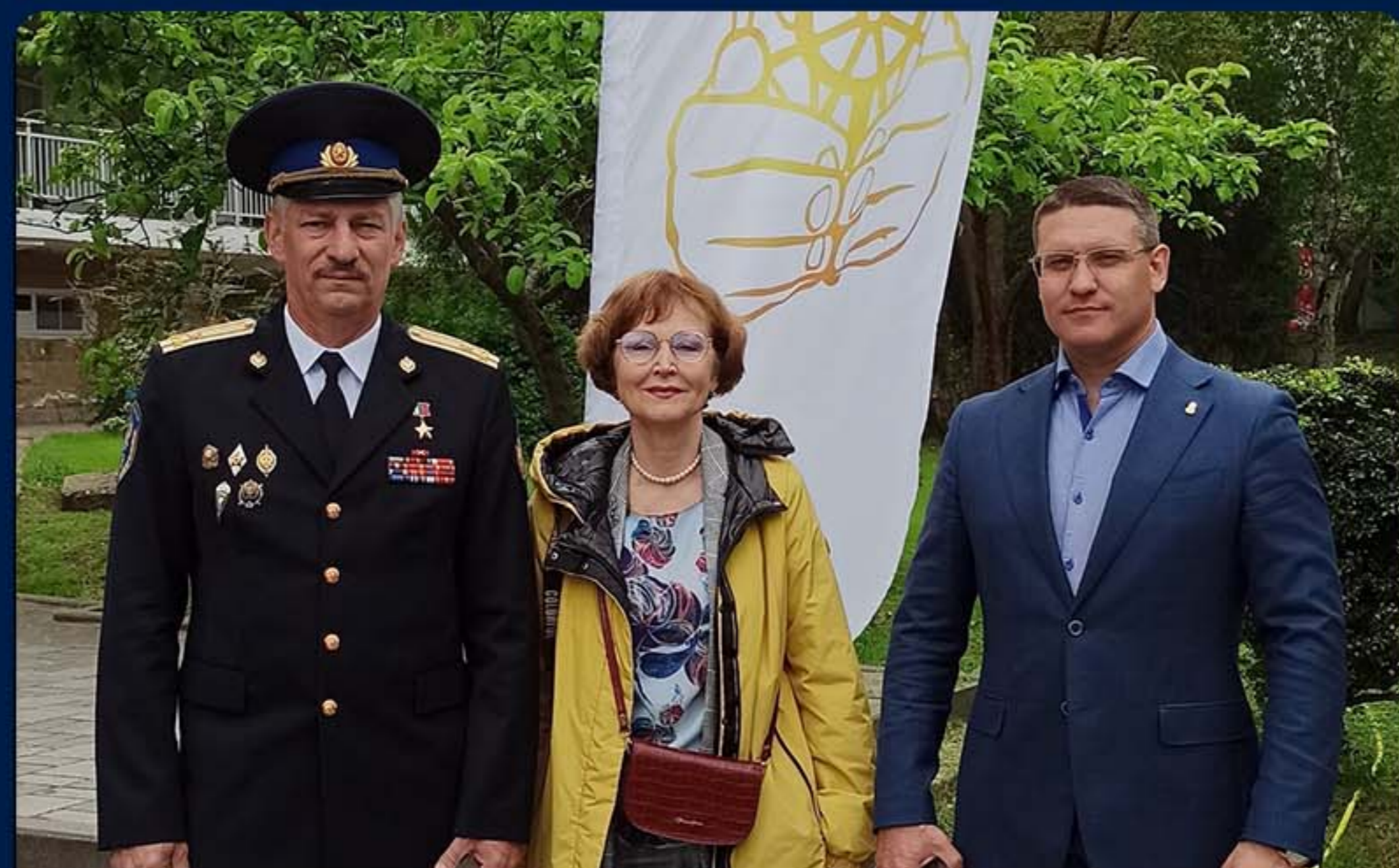
«ДИАЛОГИ С ГЕРОЯМИ». РО КРАСНОДАРСКИЙ КРАЙ