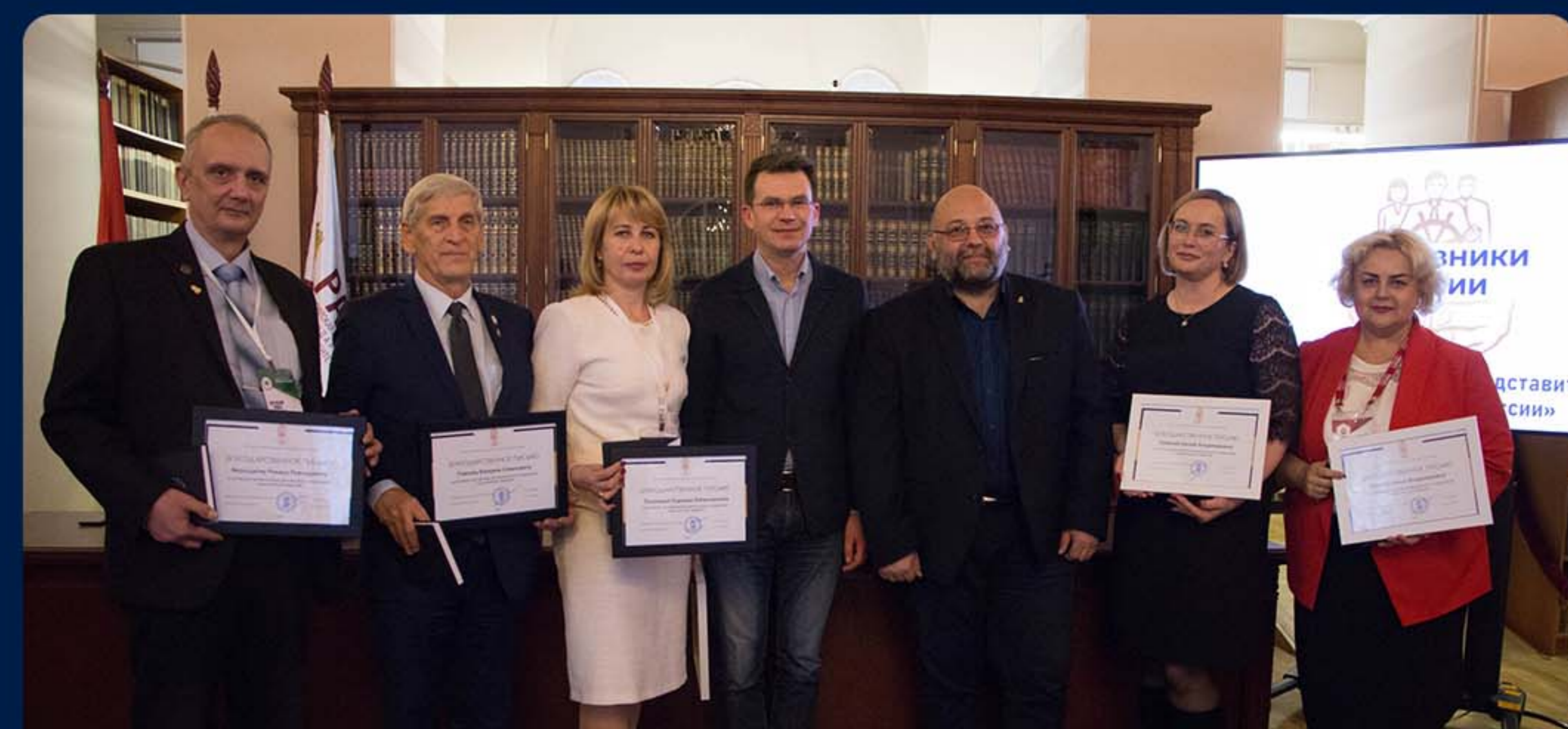
КОНКУРС НАСТАВНИКОВ УЧЕБНЫХ ГРУПП СЗИУ. РО Г. САНКТ-ПЕТЕРБУРГ