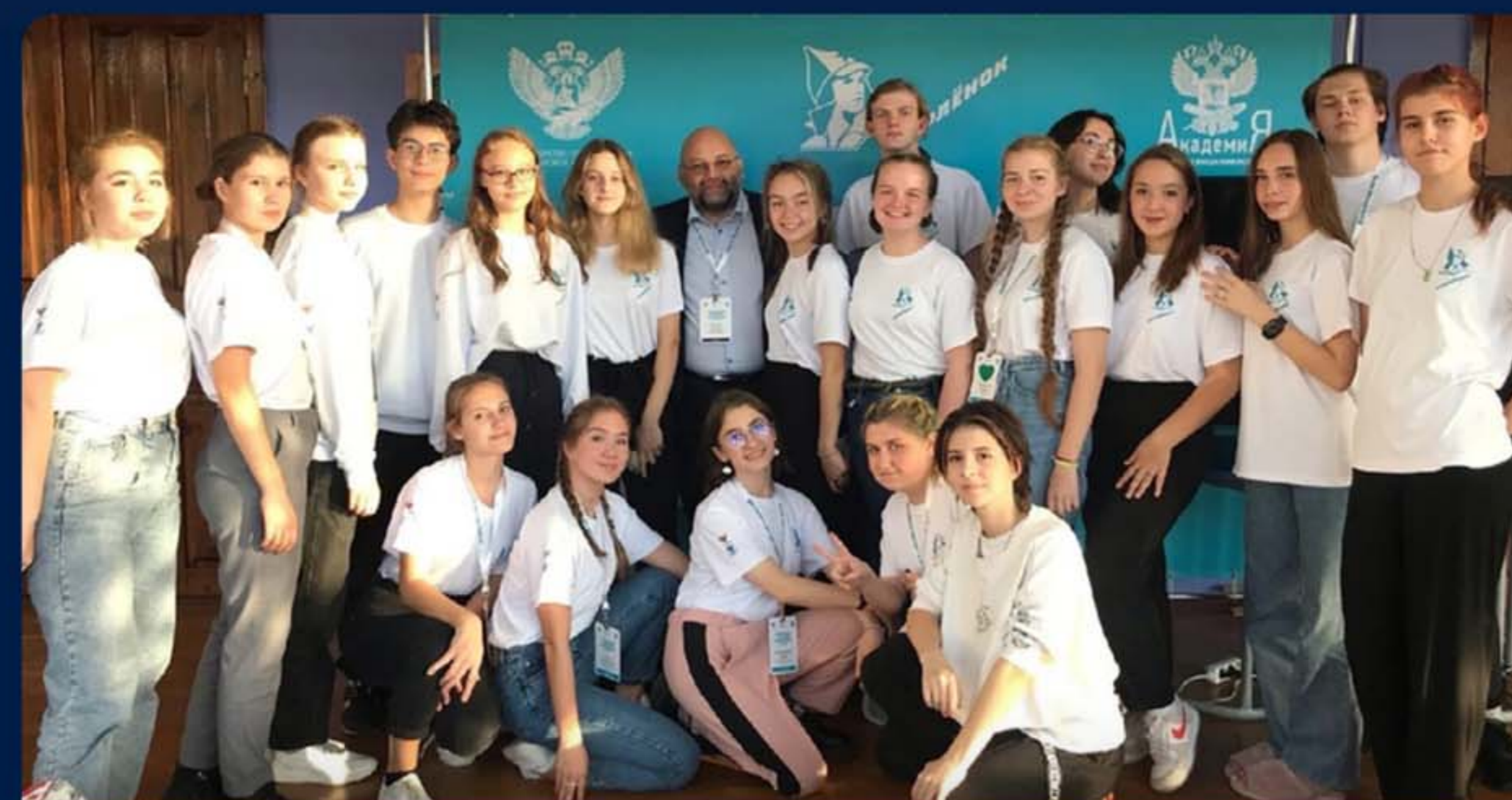
«ВСЕРОССИЙСКИЙ ПЕДАГОГИЧЕСКИЙ ФОРУМ»