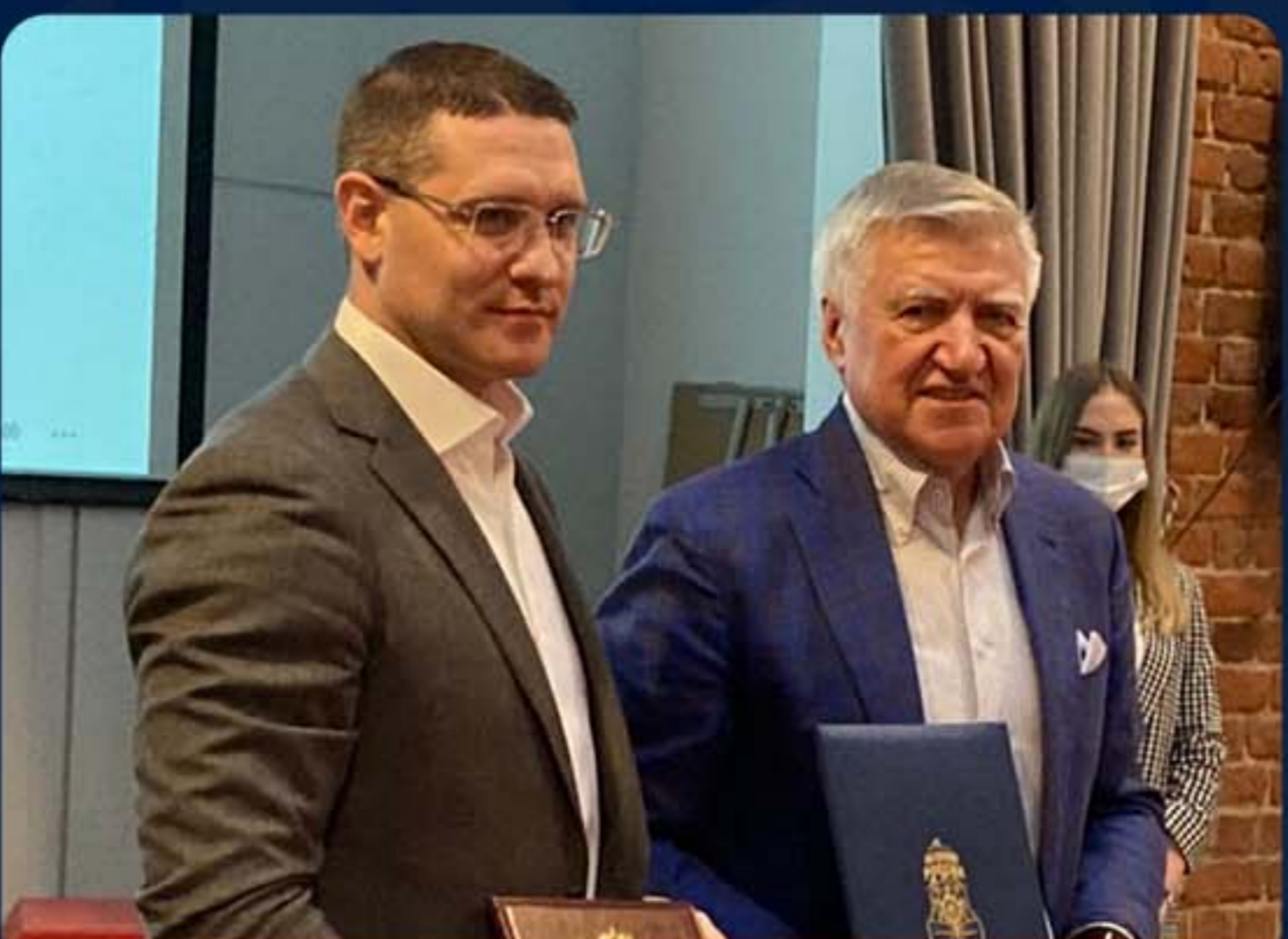
СЕВЕРО-ЗАПАДНЫЙ ИНСТИТУТ УПРАВЛЕНИЯ (ФИЛИАЛ РАНХИГС), Г. САНКТ-ПЕТЕРБУРГ