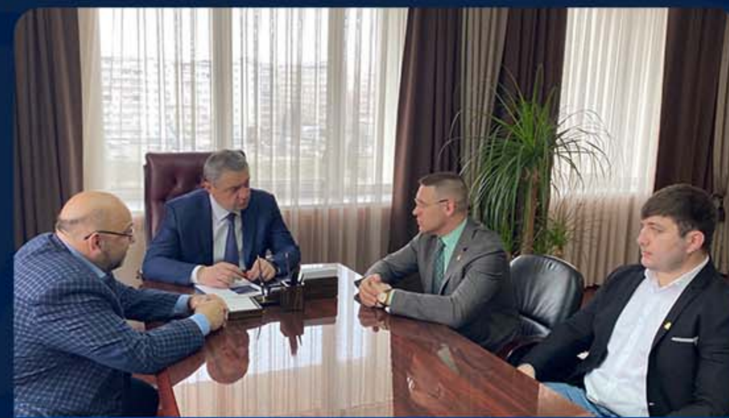
АДМИНИСТРАЦИЯ Г. ВЛАДИКАВКАЗА