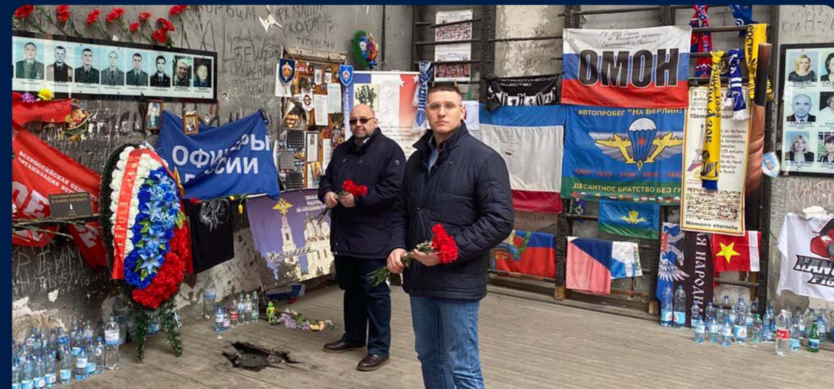
ПАМЯТНЫЕ МЕРОПРИЯТИЯ, ПОСВЯЩЕННЫ ДНЮ СОЛИДАРНОСТИ ПРОТИВ ТЕРРОРИЗМА. РО РСО-АЛАНИЯ.