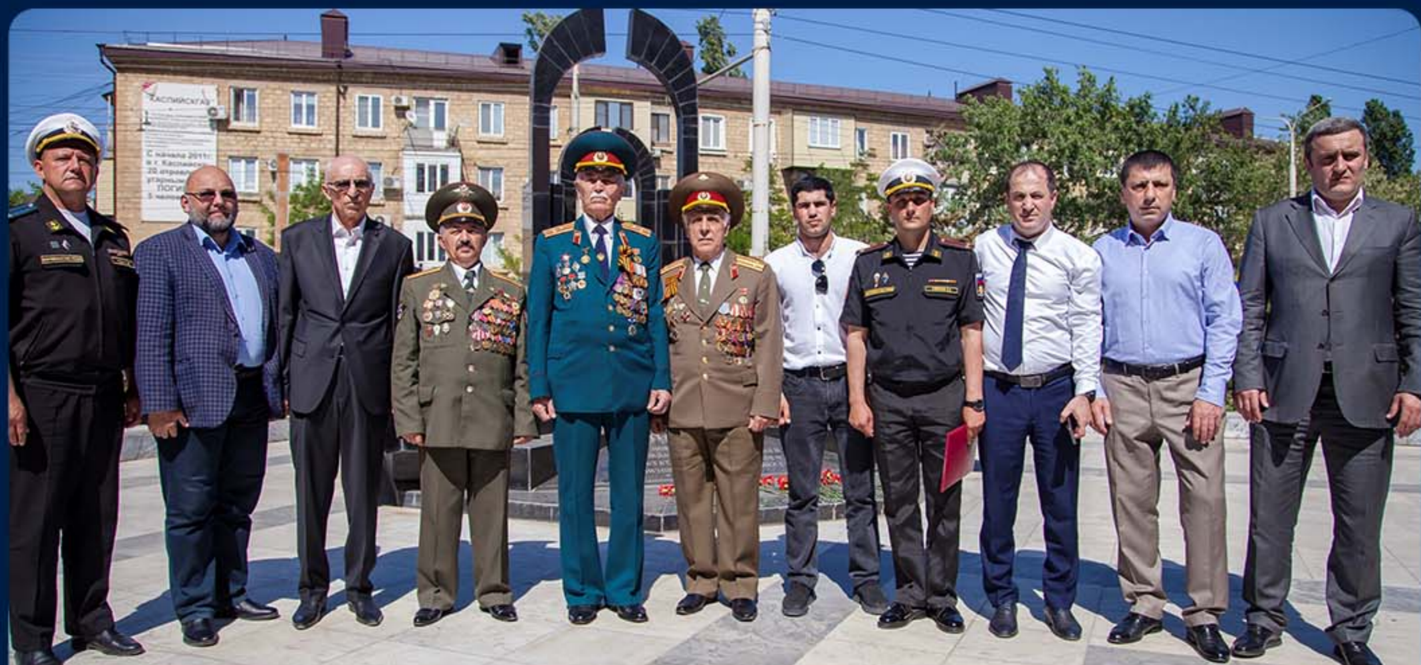
ОТКРЫТИЕ ЧЕМПИОНАТА ПО РУКОПАШНОМУ БОЮ. РО РЕСПУБЛИКИ ДАГЕСТАН.