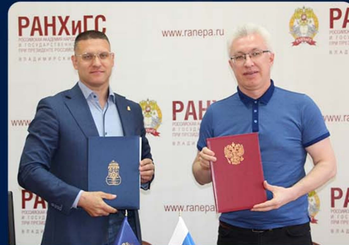
ВЛАДИМИРСКИЙ ФИЛИАЛ РАНХИГС, Г. ВЛАДИМИР