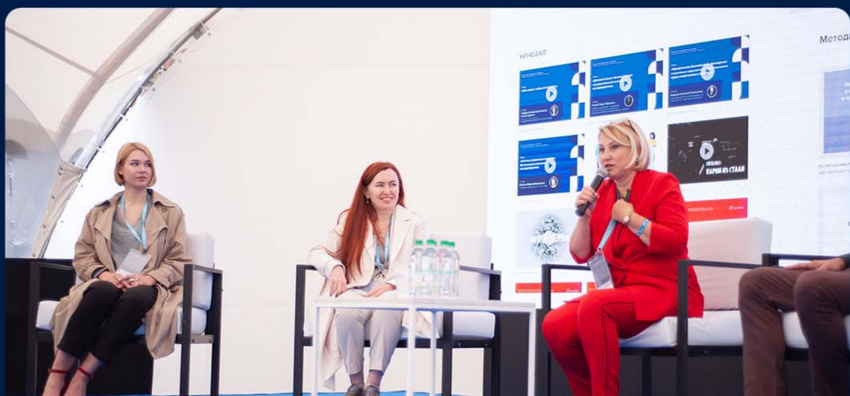
МОЛОДЕЖНЫЙ ФОРУМ «ЛАДОГА». РО ЛЕНИНГРАДСКАЯ ОБЛАСТЬ.