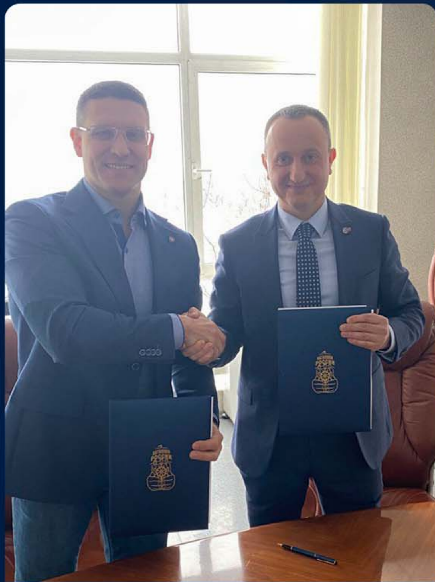
ВСЕРОССИЙСКОЕ ОБЩЕСТВО ИЗОБРЕТАТЕЛЕЙ И РАЦИОНАЛИЗАТОРОВ Г. МОСКВА