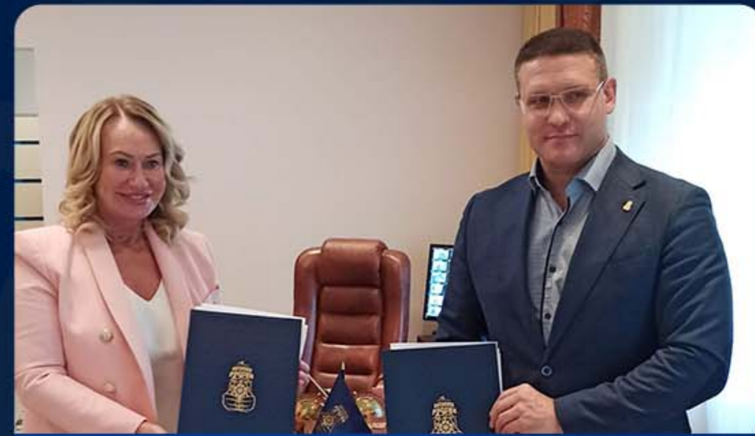
ГБОУ ШКОЛА № 1409 Г. МОСКВА