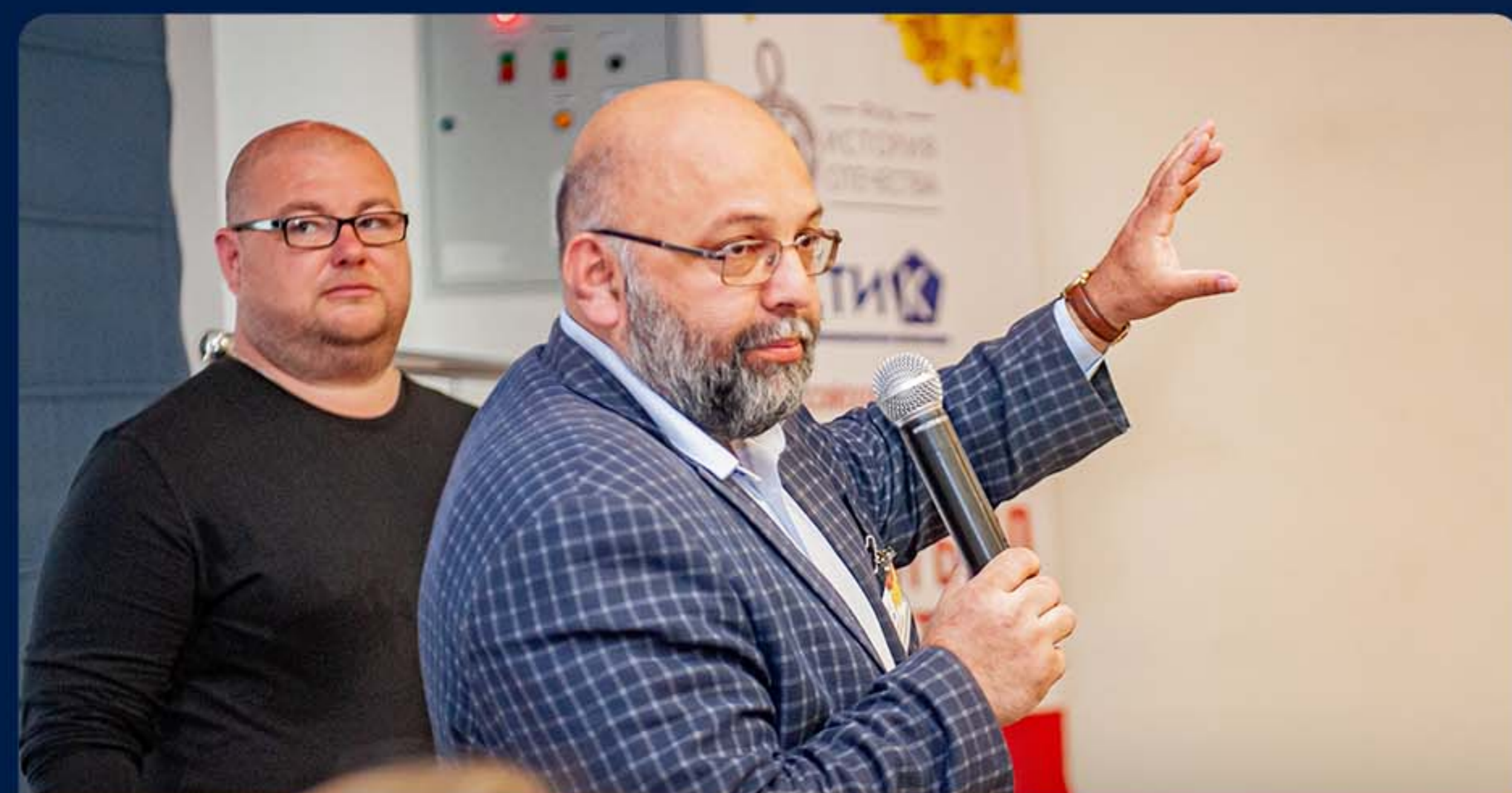
«И ТЫЛ БЫЛ ФРОНТОМ»