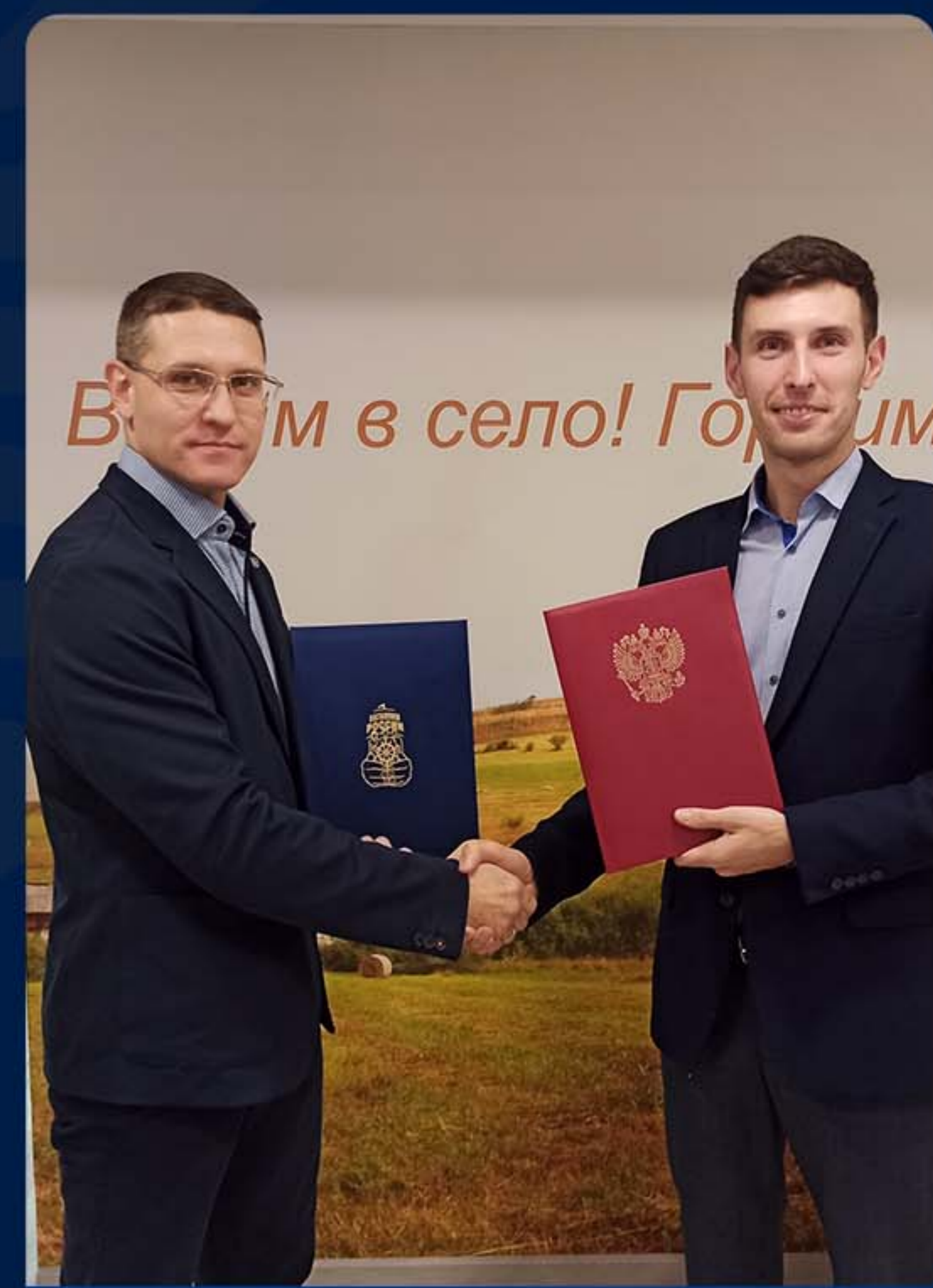
РОССИЙСКИЙ СОЮЗ СЕЛЬСКОЙ МОЛОДЕЖИ Г. МОСКВА