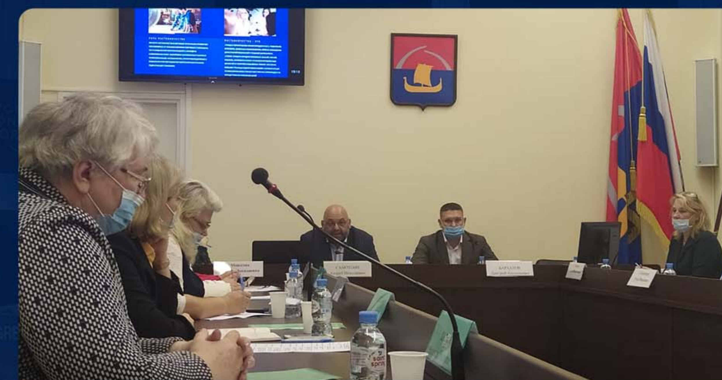
«НАСТАВНИКИ – ОСОЗНАННЫЙ ВЫБОР ИЛИ ОБЯЗАННОСТЬ»